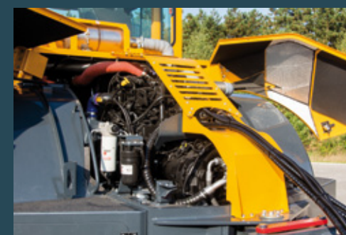
Gute Zugänglichkeit zu allen Wartungsstellen durch patentiertes Haubensystem.