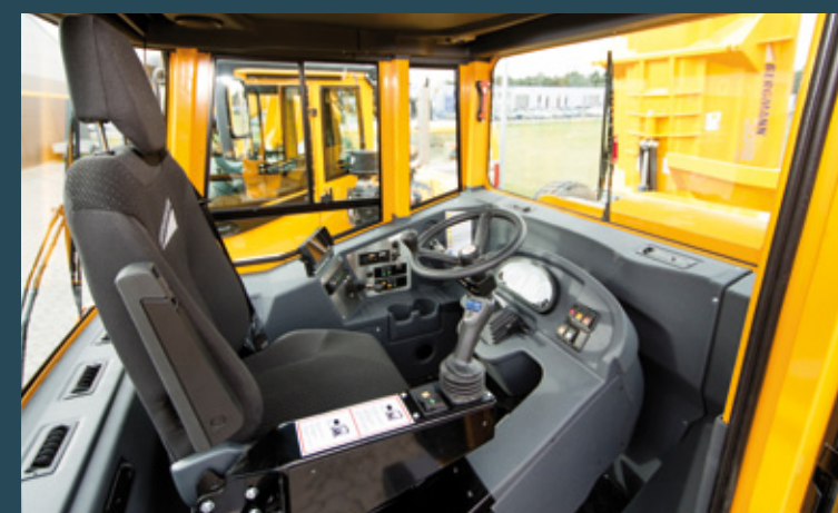
Kabine mit Drehsitz und intuitiver Bedienung.

Der drehbare Fahrerstand ist in der 12-Tonnen-Klasse einzigartig. Bei bester Übersicht ermöglicht er bei Spitzengeschwindigkeiten von 40 km/h vorwärts und 30 km/h rückwärts unterm Strich höhere Transportleistungen.