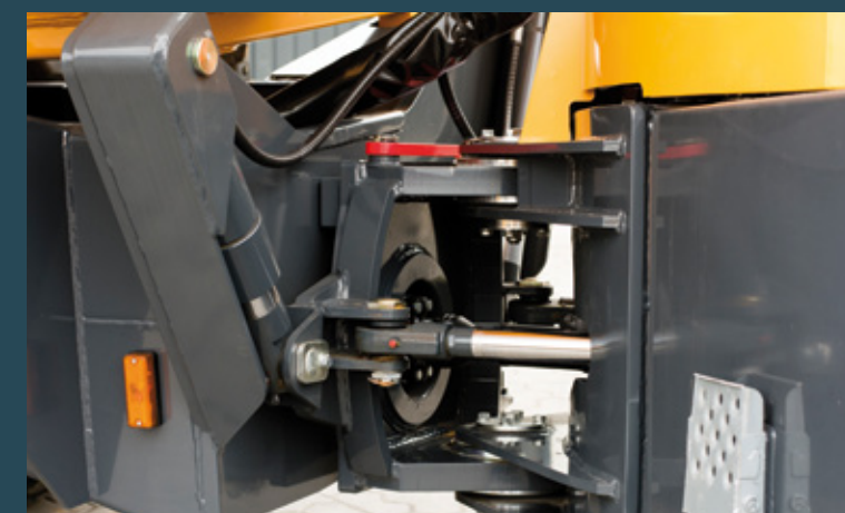
Knick-Pendelgelenk mit Stabilisierungszylinder.